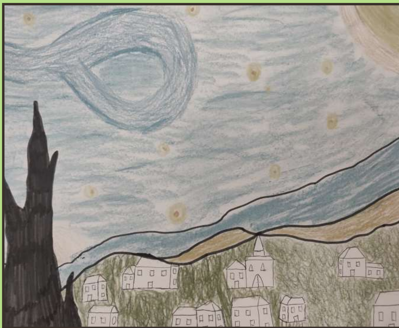
Vincent van Gogh „Gwiaździsta noc”