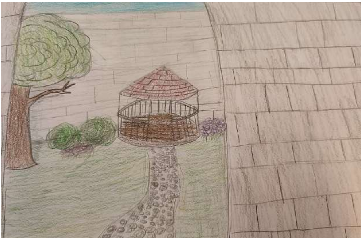
Autorka: Julia Malczak 5 c