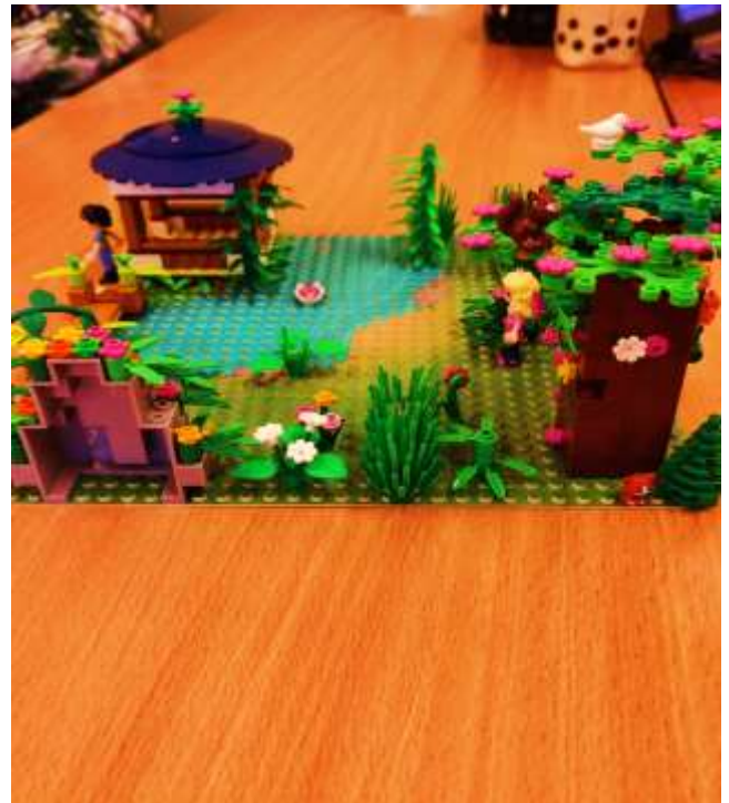
Autorka: Zofia Ćmiel 5 c