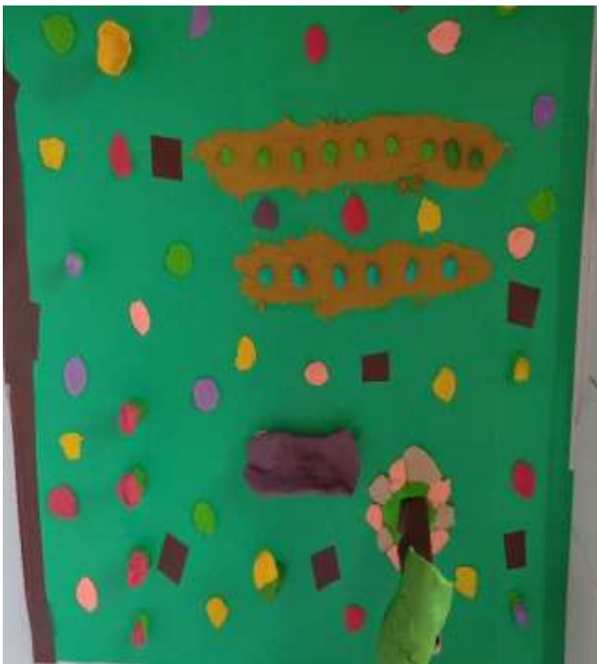
Autorka: Emilia Maciejewska - Batten 5 c