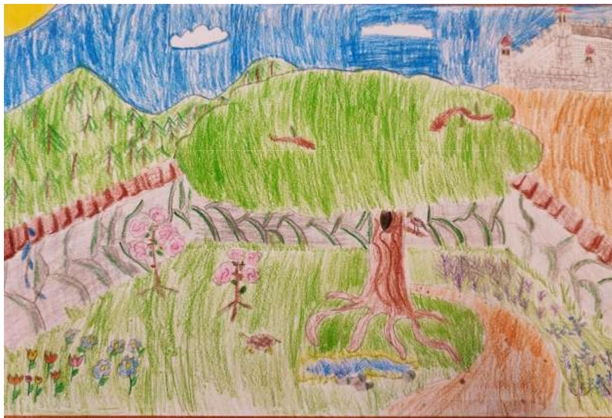
Autor: Antoni Smetana 5 c