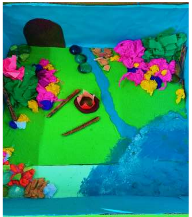
Autorki: Natalia Musiat, Sofia Khodakivska 5 c